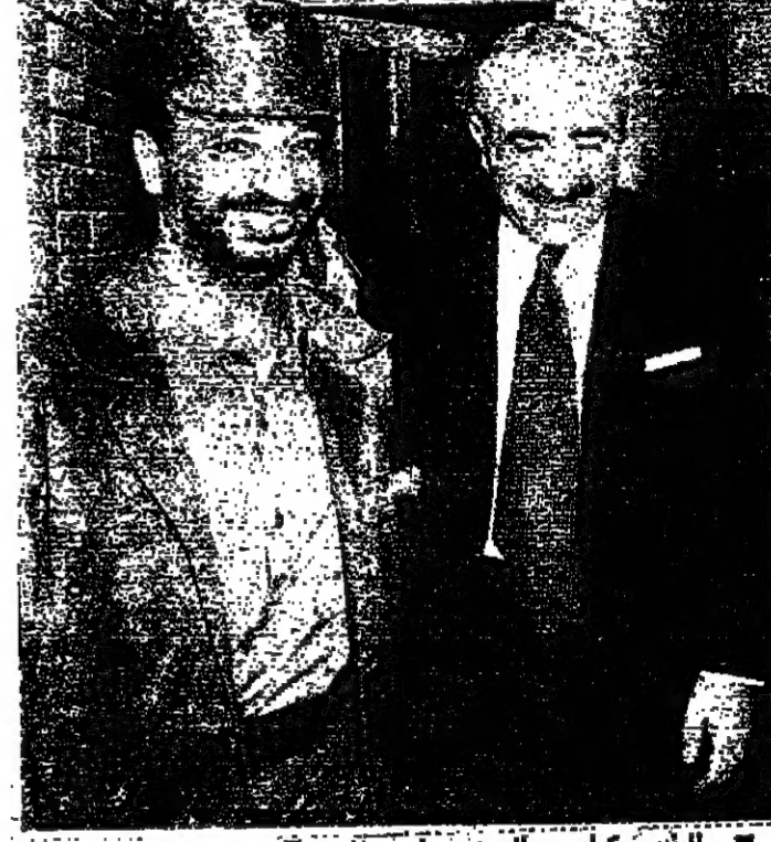
الرئيس كرامي والسيد ياسر عرفات